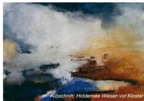
Ausschnitt: Hiddensee Wiesen vor Kloster

Angebot: Ausstellung Malerei, Zeichnungen, Aquarelle, Information über Kursangebote und künstlerische Ausbildung im Atelier, Besucher haben die Möglichkeit in Aquarelltechniken selbst zu gestalten