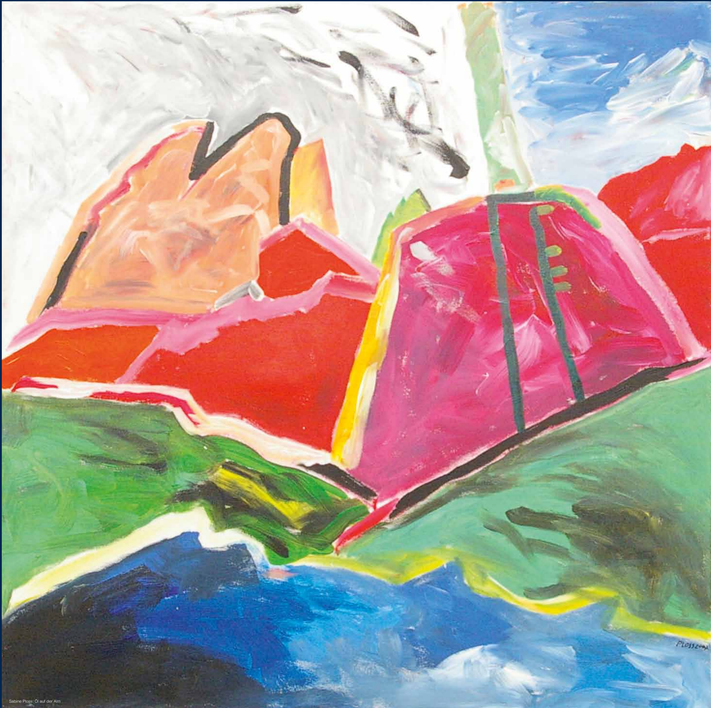
Sabine Ploss: Öl auf der Alm