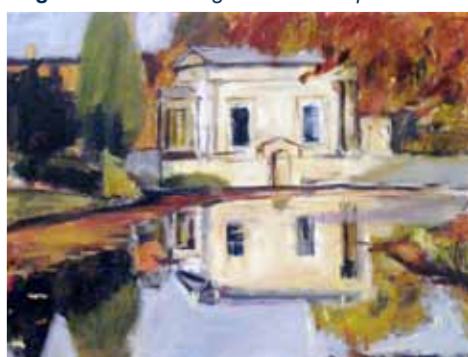
Ausschnitt: Lisa Schoefer

Angebot: Ausstellung Bilder und Aquarelle